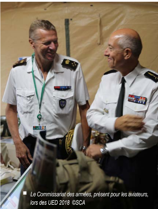
■ Le Commissariat des armées, présent pour les aviateurs, lors des UED 2018

pleinement intégrés dans le processus de planification et de conduite des opérations aériennes. À ce titre, ils détiennent une connaissance approfondie du milieu aéronautique et des processus opérationnels. Pour assurer cette mission, le SCA développe et entretient, en lien avec le commandement de la défense aérienne et des opérations aériennes (CDAOA), un vivier de LEGAD d'ancrage « air » capable de répondre au contrat opérationnel de l'armée de l'Air.