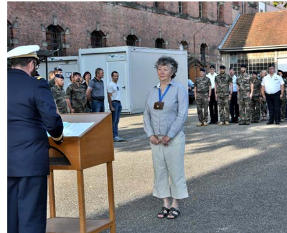
■ 28 juin 2019 : lecture de l'ordre du jour n°2 par le Chef du GS de Strasbourg-Haguenau