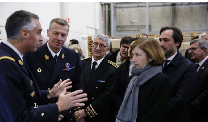
■ Le CRG2 Marcotte, Sous-directeur Numérique, le CRGHC PIAT, le Préfet et la ministre des Armées

L'ÉLoCA NG illustre la modernisation du SCA et l'amélioration du service rendu aux militaires et aux unités soutenues. La mise en production de cette nouvelle plate-forme logistique coïncide avec l'arrivée d'effets nouvelle génération (tenue de sport renouvelée, gants de combat, sous-vêtements temps froid techniques, couteau de combat, d'assistance et de vie en campagne, nouvelle tenue de protection de base, etc.) dont elle va favoriser le déploiement rapide auprès des forces. Ce projet s'inscrit pleinement dans l'esprit de la LPM à hauteur d'homme, garantissant le financement des équipements du combattant et la modernisation des outils logistiques du