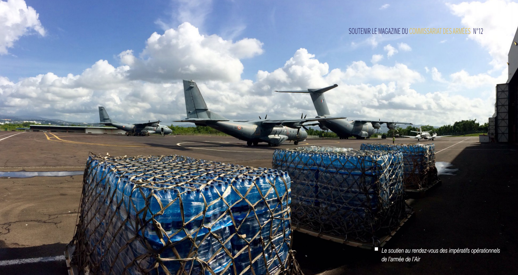
■ Le soutien au rendez-vous des impératifs opérationnels de l'armée de l'Air

pleinement intégrés dans le processus de planification et de conduite des opérations aériennes. À ce titre, ils détiennent une connaissance approfondie du milieu aéronautique et des processus opérationnels. Pour assurer cette mission, le SCA développe et entretient, en lien avec le commandement de la défense aérienne et des opérations aériennes (CDAOA), un vivier de LEGAD d'ancrage « air » capable de répondre au contrat opérationnel de l'armée de l'Air.