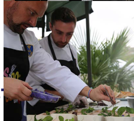
Rencontre avec le chef Thierry Marx, parrain de cette édition