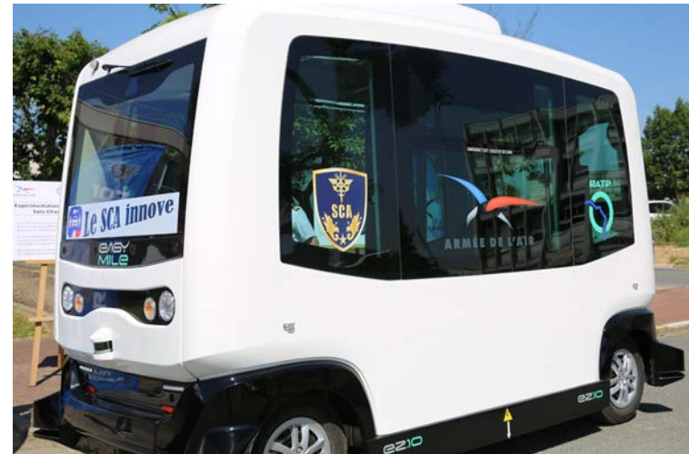
Expérimentation de la Navette Autonome Sans Chauffeur (NASC) sur la BA 107 de Vélizy-Villacoublay

Le GS d'Évreux par exemple, qui se trouve sur une emprise de 800 hectares, a officiellement lancé le